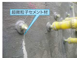
超微粒子セメント系注入材本注入の状況