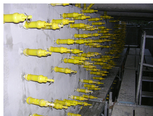
リハビリシリンダー設置状況