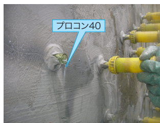
プロコン40先行注入の状況